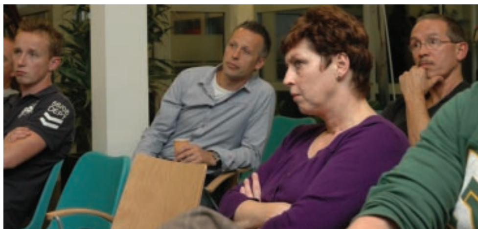
De aanwezigen konden luisteren naar een aantal interessante uiteenzettingen

Na een korte pauze was er voor de aanwezigen de gelegenheid om een