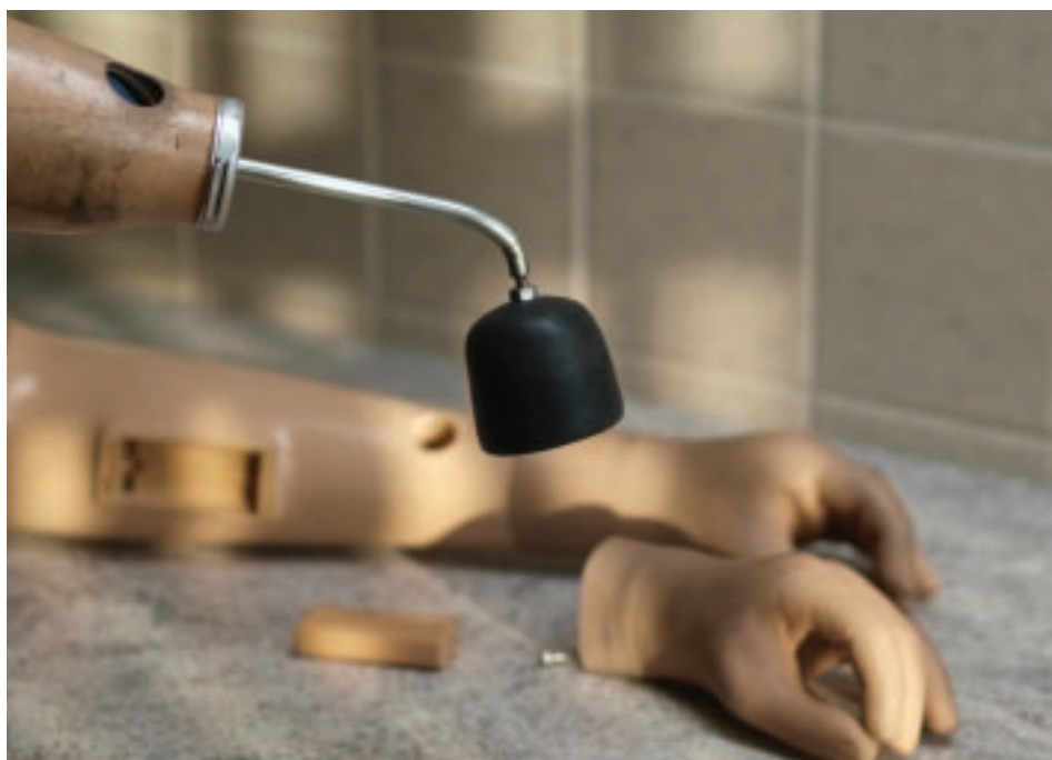
De onderarmprothese van een heftruckchauffeur werd met een siliconen knop zo aangepast dat hij veilig kan werken

these door middel van een siliconen knop zo is aangepast dat hij veilig kan werken. “De basis hiervoor was een door hem zelf bedachte aanpassing. Het gevaar daarvan was dat hij hiermee vast zat aan de vorkheftruck. Levensgevaarlijk natuurlijk bij een ongeval. Dat voorkomen we nu met deze maatwerkoplossing. En zo zijn er vele creatieve oplossingen die ons beroep zo mooi maken en waarmee we klanten een groot plezier kunnen doen.”